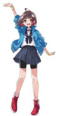
かこのちゃん@加古川市

「まいぷれ加古川」及び 「かがわウェルビーポイント」については 「まいぷれ加古川」で情報発信しています TEL: 079-440-9039