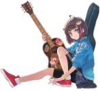
かこのちゃん@加古川市