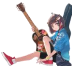
かこのちゃん@加古川市