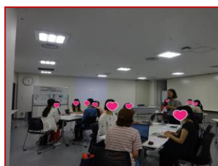
▲6/28 Canva でつこう！ あなたの伝えたいことが 伝わるインスタデザイン 【初心者向け】 (企画：起業女子のひとやすみ会)