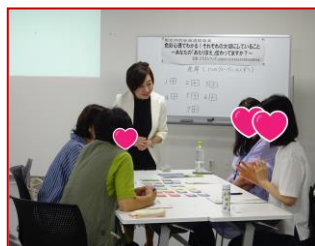
▲6/24 色彩心理でわかる！ それぞれの大切にしていること ～あなたの「あたりまえ」 伝わっていますか？～ (企画：とうばんウィス)