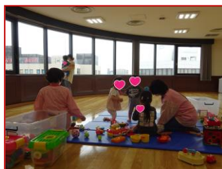
▲6/23 リフレッシュタイム For You! (企画：トライアングル)