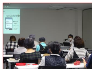
▲6/29 安心・安全・便利に使う ためのスマホ入門講座 (企画：加古川市友の会)