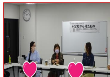
▲6/25 不登校から得たもの (企画：ひまわり)

毎年6月23日から29日までの1週間は「男女共同参画週間」です。この期間に合わせ、性別に関わらずそれぞれの個性と能力を発揮できる男女共同参画社会の実現を目指し、市民グループの皆さんと協働で講座を開催しました。子育てや介護、起業など、“自分らしく生きる”ことをテーマにしたさまざまな講座を、各団体が企画立案し、当日の運営まで行いました。たくさんの方々にご参加いただき、盛況のうちに終了しました。