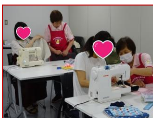
▲6/27 ママソーイング 子どものための ナップザックづくり (企画：加古川市連合婦人会)