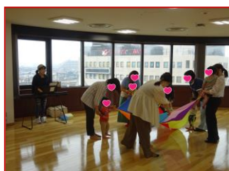
▲6/26 先輩起業家のお仕事のぞき見！ (企画：起業カフェ加古川)