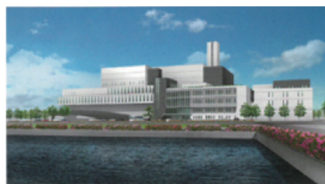
▲エコクリーンピアはりま