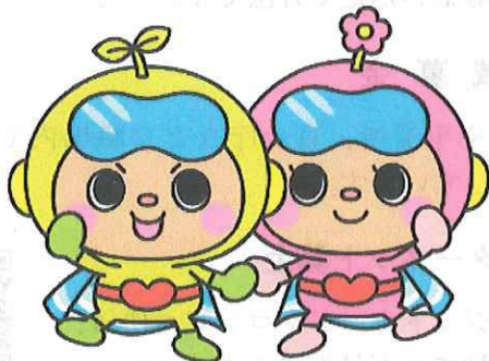
双子のヒーロー ふくくん かこちゃん © 市内の地域福祉のために