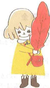
あかはねちゃん