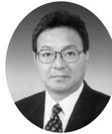
大西 健一 （公明）