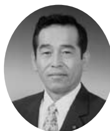
山川 博 （共産）