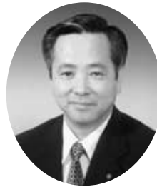
中山 廣司 （公明）