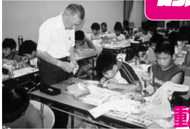
「夏休み小学生工作教室」では、モーターで動く恐竜を作りました(7月29日、総合文化センター)。