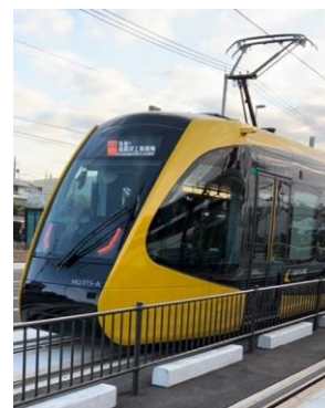
基幹公共交通として 整備したLRT

また、道路ネットワークの整備としては、都市計画道路等の整備を進 めることで、バスや自動車の利便性向上及び公共交通と自動車の相互の 連携強化を図っている。令和5年8月には、基幹公共交通としてLRT (次世代型路面電車システム)が開業し、その駅のうちの5か所に、移 動しやすい交通環境を整備するため、バス、デマンドタクシー等の地域 内交通、自転車等の複数の交通手段をつなぐトランジットセンター(乗 り継ぎ施設)を設けている。