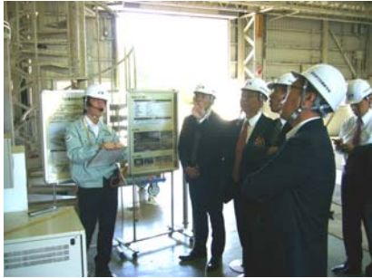
▲大型耐震実験施設の見学