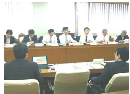
▲熱心な質疑が交わされた

文部科学省の研究報告によると、ICTを活用した授業について、小・中学生の9割が「楽しく学習できた」と回答し、8割以上の教員が、子どもの学習意欲や理解を高めることに効果的であると評価している。現在、通信関連企業においても、当該事業の実証実験などを進めるところもあり、また、全国的にタブレット型パソコンの導入が進む中、本市においても、今後さらなる調査研究が必要と考える。