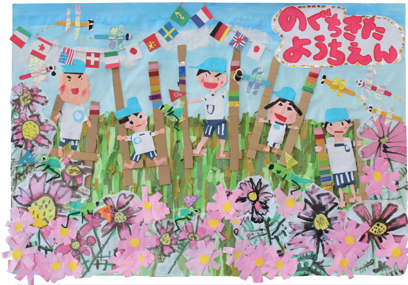
「秋の応援団に囲まれて、フレー！フレー！竹馬！！」 野口北幼稚園（4歳児・5歳児合同制作） 澄んだ空にトンボが飛び交い、コスモス畑では「秋がやってきた！」とバッターも大喜び！移り行く季節を感じながら、自然の中で一生懸命、竹馬に挑戦する子どもたちの目もキラキラと輝いています。「頑張って乗れるようになった竹馬を運動会で披露したい！」と、目標に向かって頑張る子どもたちをみんなが応援してくれているね♪