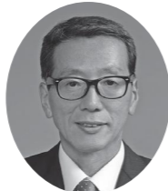
野村 明広 (公明)