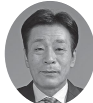
白石 信一 (公明)