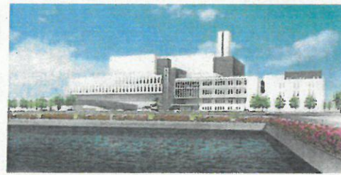
▲エコクリーンピアはりま

加古川市の燃やすごみは、2市2町(加古川市・高砂市・稲美町・播磨町)で運営する新しいごみ処理施設(高砂市)で焼却することになります。 令和4年2月以降、ごみの自己搬入を行う場合も、エコクリーンピアはりま(所在地:高砂市梅井6丁目1-1)へお願いします。 また、ごみに関するお問い合わせ先が変更となります。