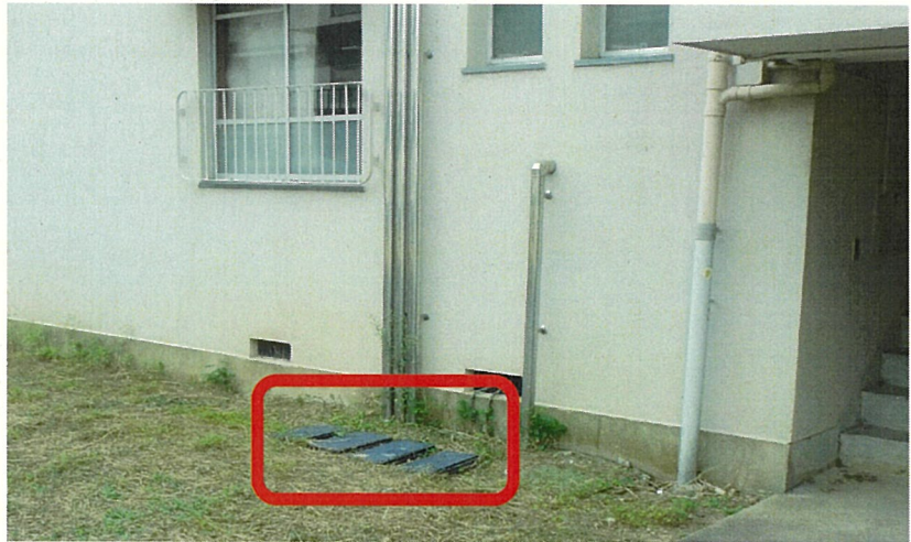
↑ 水道メーター設置場所