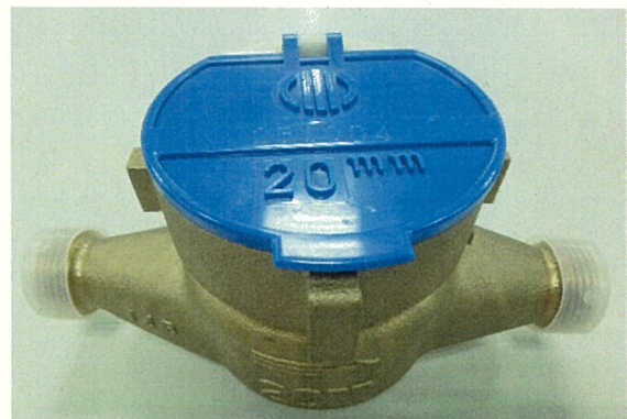
↑ 盗難にあったものと同型の 水道メーター（20mm）