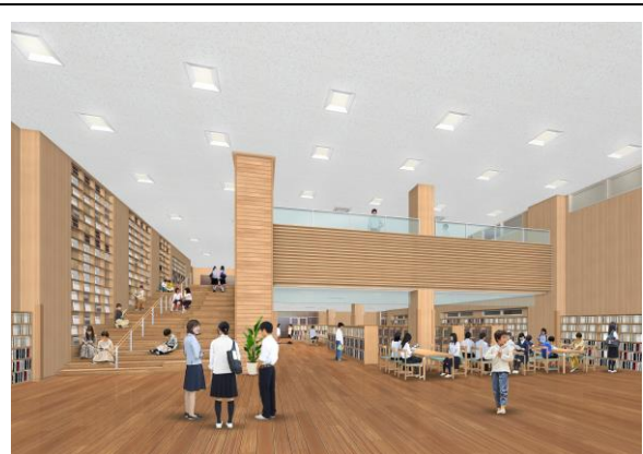
③図書室イメージ図