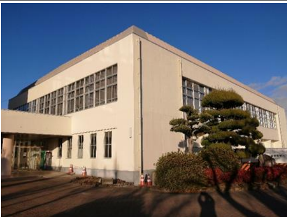
⑦体育館の外壁改修（1月末完成）