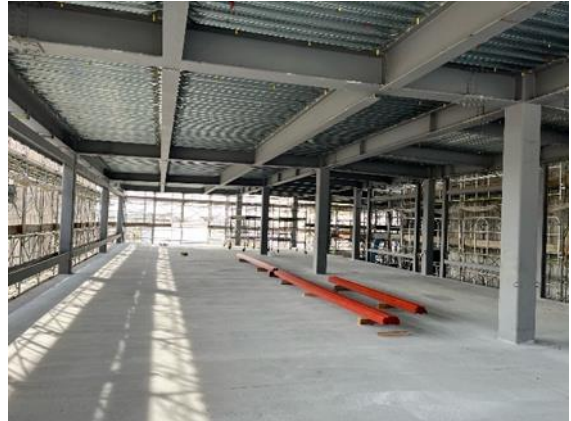
①教室棟増築部の内部状況