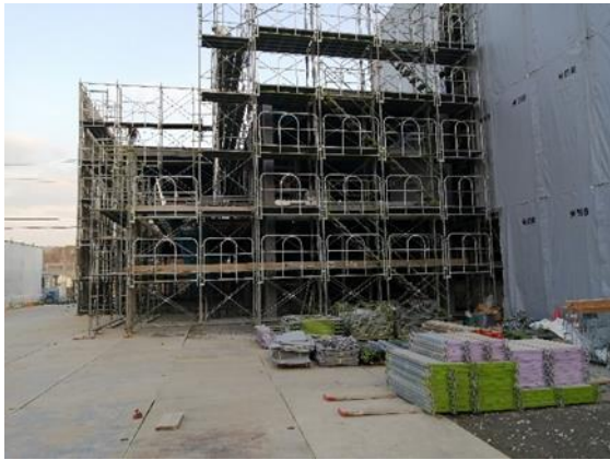
①教室棟増築部の鉄骨工事