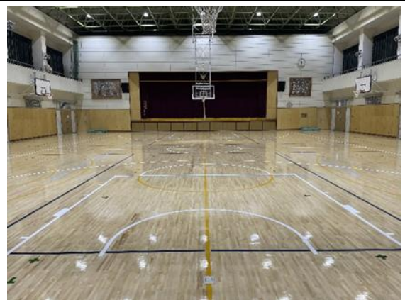
⑦体育館の床改修（1月末完成）