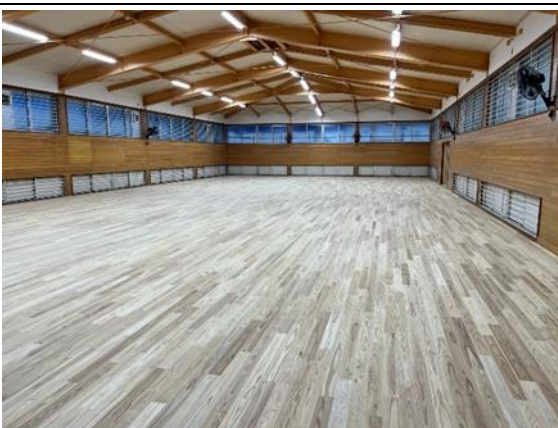
⑧武道場床改修（2月現在）