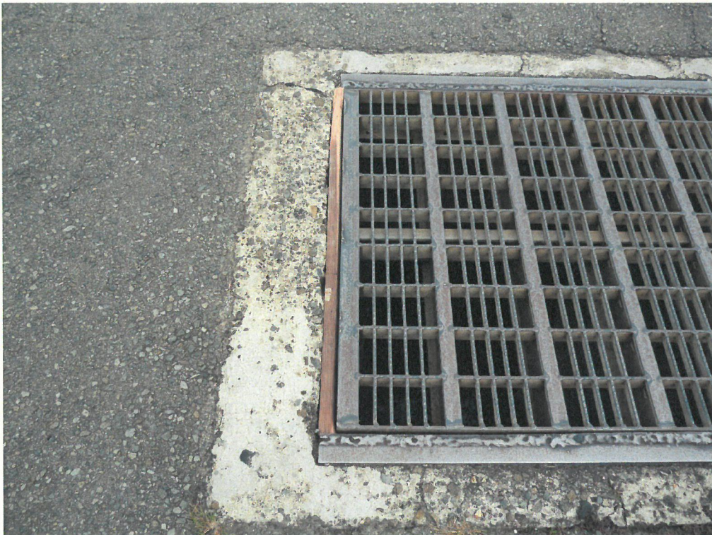
応急措置後 の状況