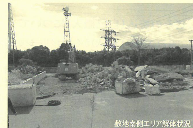
敷地南側エリア解体状況