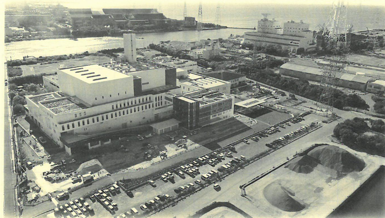
北西側上空より撮影

東播臨海広域市町村圏(高砂市、加古川市、稲美町、播磨町)における 広域ごみ処理施設建設工事の進捗状況等についてお知らせします。