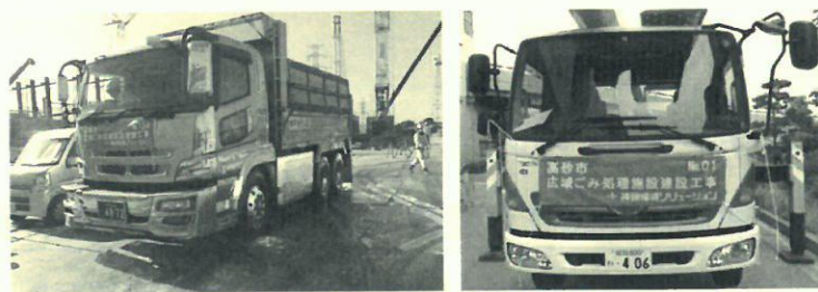
トラックスケール計量 マスク表示(青地に白文字)

また、本事業の工事関係車両であることを明示するため、車両前面にマスク表示をしています。