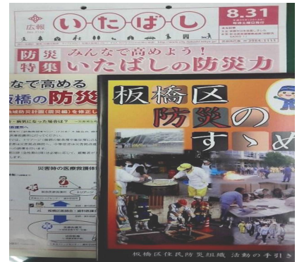
▲区広報の特集や冊子で防災対策をPR

東京都をはじめ、関東や東海エリアではかなり以前から大規模地震の発生する可能性が高いとの認識のもと、防災対策を積極的に進めてきた経緯があり、担当職員の説明からもそれが十分伝わってきた。東日本大震災の際には、多数の帰宅困難者への対応など新たな問題も生まれ、54万区民プラス数万人に対し、行政が3,500人の職員数で対応することはとても無理だと実感したという。そこで条例には新たに「区民の責務」を加え、災害時には普段からの備えと自助・共助の必要性を挙げている。これをいかに促すかが行政の腕の見せどころだと感じた。