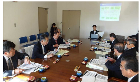
▲導入事例の説明に対し、活発な質疑が交わされた

我孫子市では、事業仕分けにも取り組んでいるが、それより以前の平成17年に市長からのトップダウンにより、コスト削減とともに職員数の減少を補うべく、市の事業のすべてをオープンにし、民間から提案を募り、その内容が市の方針にかなっていれば任せてしまうといった新しい手法を取り入れた。事業化に至った経緯や制度の中身、成果などを調査した。