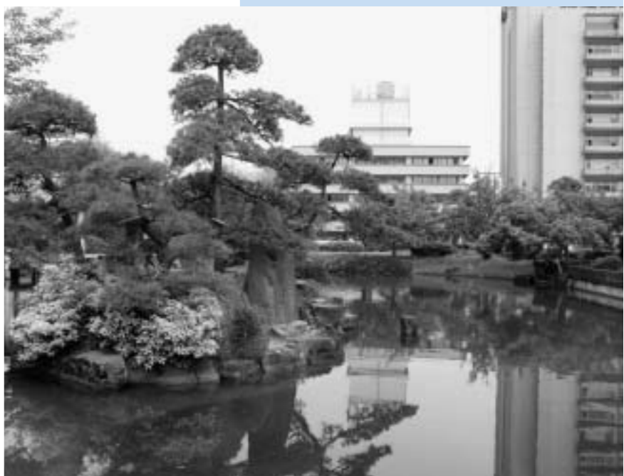
市役所庁舎前にある「鹿児の庭」

すべての教育の出発点であり、なかでも親の果たすべき役割は極めて大きいことから、親学は重要であると認識している。本市では、子育て中の親に対し、家庭教育大学など多くの事業を実施している。今後は、親学をテーマに活動している団体を積極的に支援、協力するとともに、家庭・学校・地域行政が力を合わせ、子供を育てていく体制づくりを推進していきたい。その他の質問項目