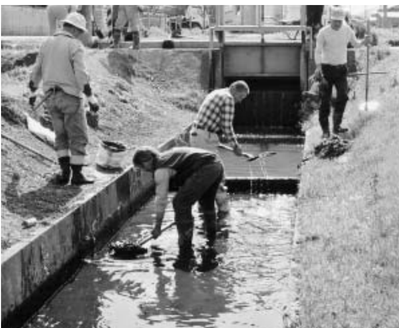
農業用水路の清掃活動