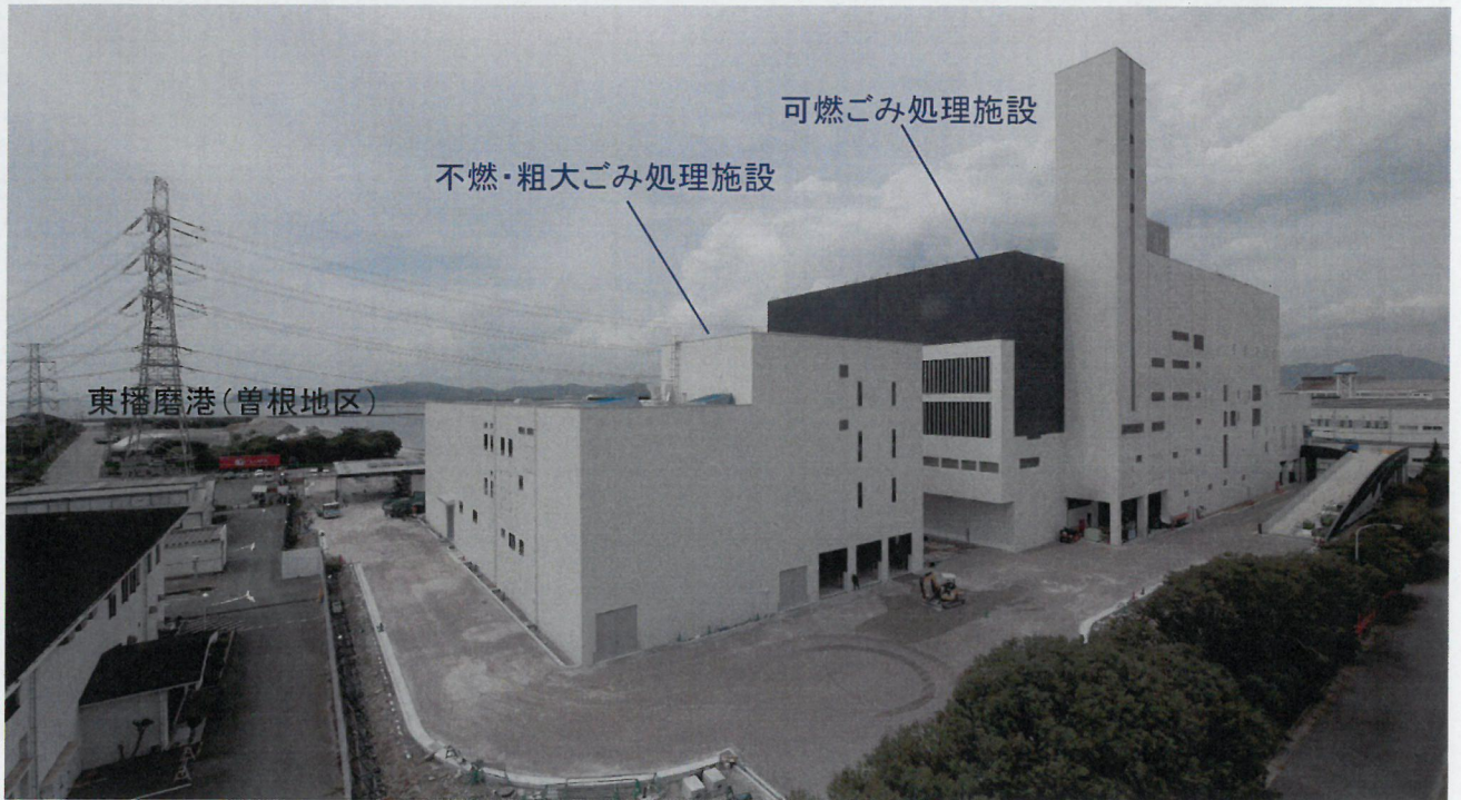
敷地南東側 伊保浄化センター汚泥処理棟屋上から東播磨港(曾根地区)方向を撮影