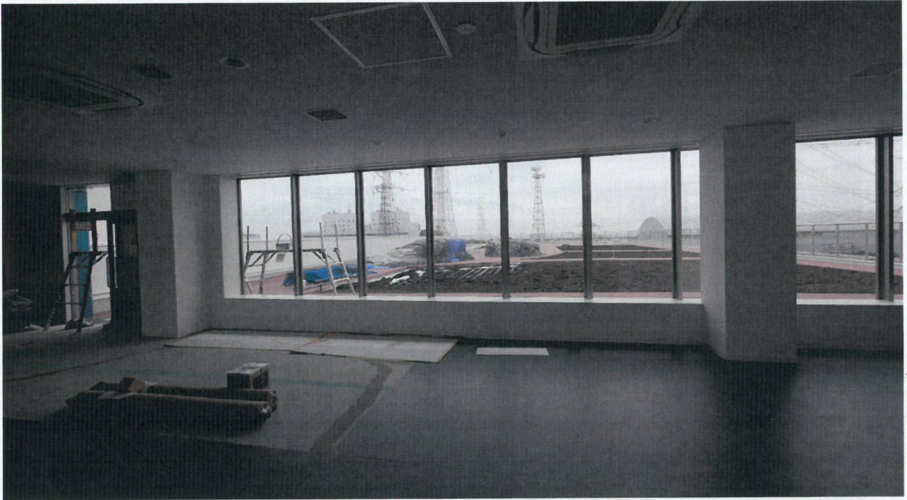
管理棟5階ホールから屋上庭園を撮影