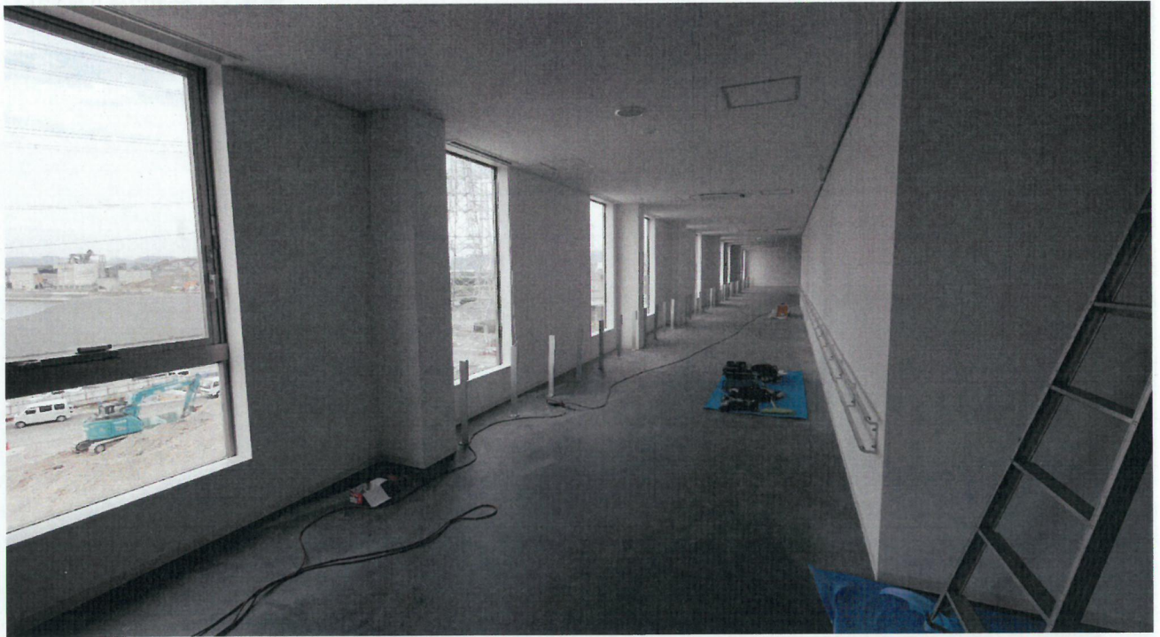
可燃ごみ処理施設3階見学通路