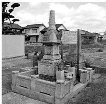
宝篋印塔(南東から)

基礎上部の反花座の上に、さらに重ねるように高さ12cmの反花座がありますが、これは様式からみて江戸時代後期のものと考えられ、後世の補修によって取り付けられたとみられるため、兵庫県指定文化