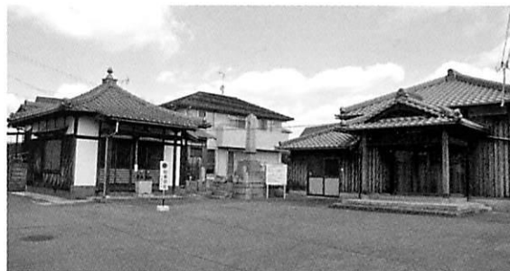
土山共同墓地前的大師堂と公会堂分室