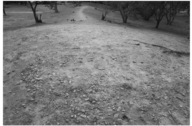
後円部中央の石敷

これまで本格的な発掘調査が実施されたことはありませんが、昭和期に実施された周濠部分における確認調査で少量の えんとうはにわ 円筒埴輪片が出土しています。このことから、少なくとも埴輪を樹立した古墳であったことがわかります。葺石の有無については明らかにされていません。 まいそう 埋葬施設については、大部分が削平によりすでに失われていますが、後円部中央に2.5m×3.4mほどの範囲で れき 小礫が確認されており、 ぼこう 墓壇底面に敷かれた排水のための礫敷である可能性が指摘されています。