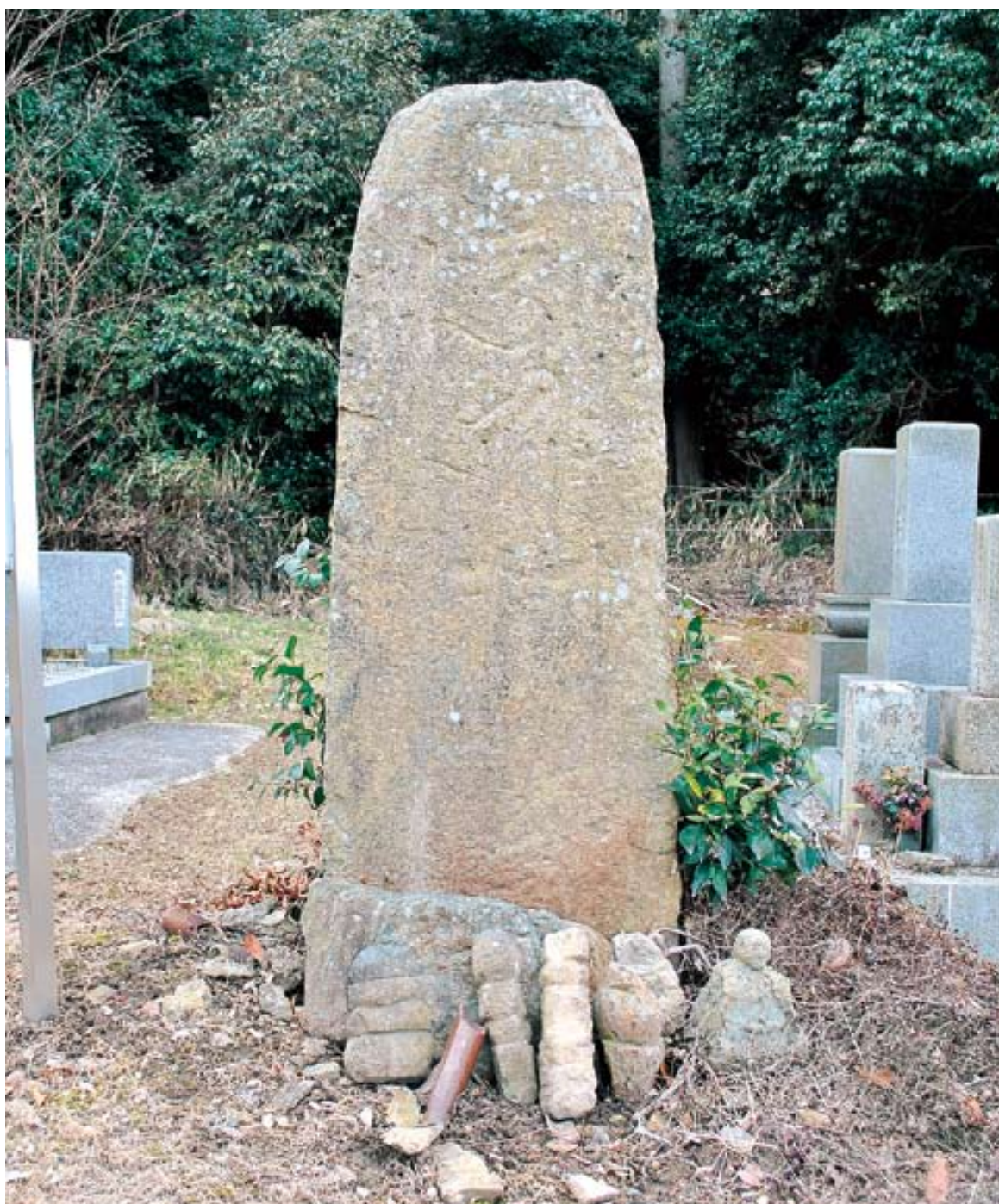
弥陀三尊種子板碑