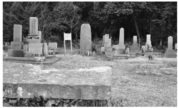
弥陀三尊種子板碑全景