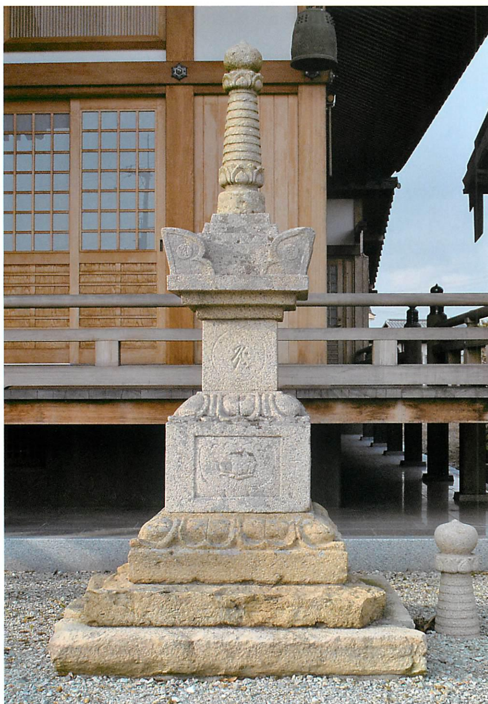
円福寺の宝篋印塔