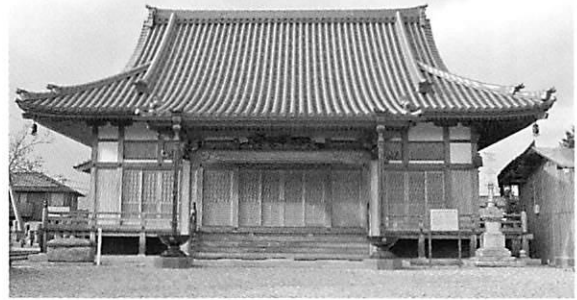
円福寺本堂(左が石棺、右が宝篋印塔)