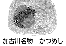
加古川名物 かつめし

5月29日は かつめしの日 「かつめし」は加古川市のご当地グルメです。給食でも登場する大人気メニューです。