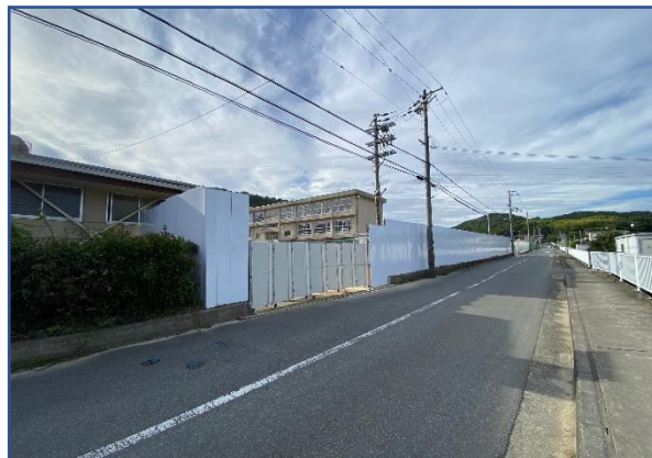
両荘中学校東側から（9月5日時点）

今年8月から両荘みらい学園の建設工事を開始しました。今年度は体育館、武道場、特別教室棟（北校舎）の改修、新たな教室棟やエレベーター棟の増築などを行う予定です。8月から9月は樹木や倉庫の撤去、工事範囲の仮囲いなど、本格的な建設工事に向けた下準備を行いました。また、特別教室棟改修を行うため、教室にある備品や机などを一時保管用の仮設倉庫に移動させる引越作業も行いました。工事は学校の建物全体に関わりますが、段階的に工事を行うことにより、安全及び学習環境に配慮しますので、ご理解、ご協力をお願いいたします。