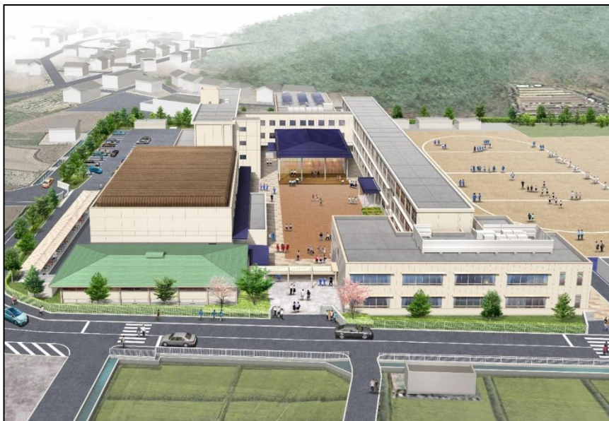
東側上空からのイメージ図

今後は、より細かな仕様の検討を進め、令和4年度から工事に着手する予定としています。