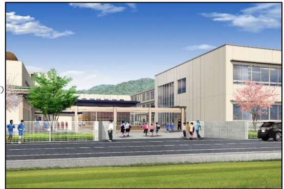
新東門からのイメージ図