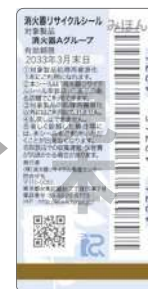
新品用シール (見本)

製品にはリサイクルシールが貼られています。消火器の使用期限が過ぎたら、取り扱い窓口へ引き渡してください。