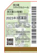
既製品用シール (見本)