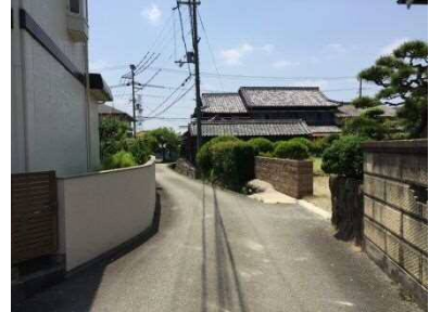
集落の道路と家並み