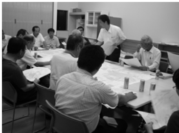
第 2 回協議会の様子