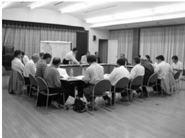
第 1 回協議会の様子