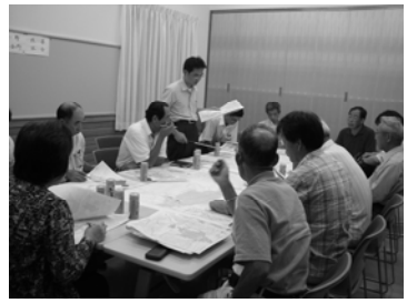
第 3 回協議会の様子

（平成 20 年度まちづくり協議会活動経緯） 平成 20 年 5 月 23 日（金）小野公会堂において、「第 1 回まちづくり協議会」を開催しました。町内住民の皆さん 16 名、市開発審査課職員 2 名、まちづくりアドバイザー 2 名が参加し、平成 19 年度の検討成果を確認した後、平成 20 年度の活動内容の説明を受けました。6 月 3 日（火）から 15 日（日）の間には、将来の土地利用の意向を地権者の皆様に確認するため、土地活用意向調査のアンケートを実施しました。