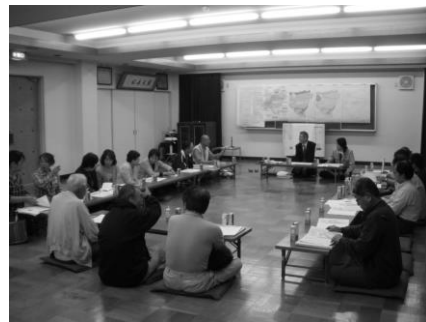
第3回協議会の様子