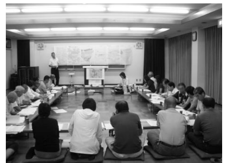
第 1 回協議会の様子

平成 21 年度第 2 回まちづくり協議会は、8 月 28 日（金）19：30 から開催いたします。今回は、今までの検討成果を再確認し、地区のまちづくりに関する方針、土地利用計画及び特別指定区域の縦覧の案を完成させる予定であり、住民全員に参加を呼びかけています。皆様にはお忙しいと思いますが、ご参加・ご協力くださいますようよろしくお願いいたします。