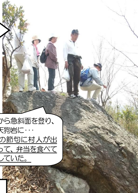
大山谷池から急斜面を登り、ようやく天狗岩に…昔は端午の節句に村人が出かけていって、弁当を食べてお祝いをしていた。