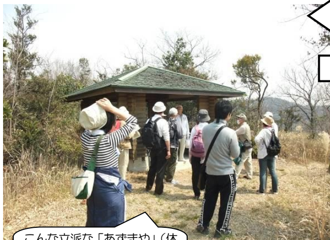
こんな立派な「あずまや」(休憩所)があったんだ～。(ここで昼食(手作り弁当))