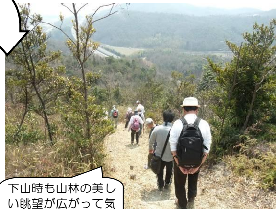
下山時も山林の美しい眺望が広がって気持ちいいね～。