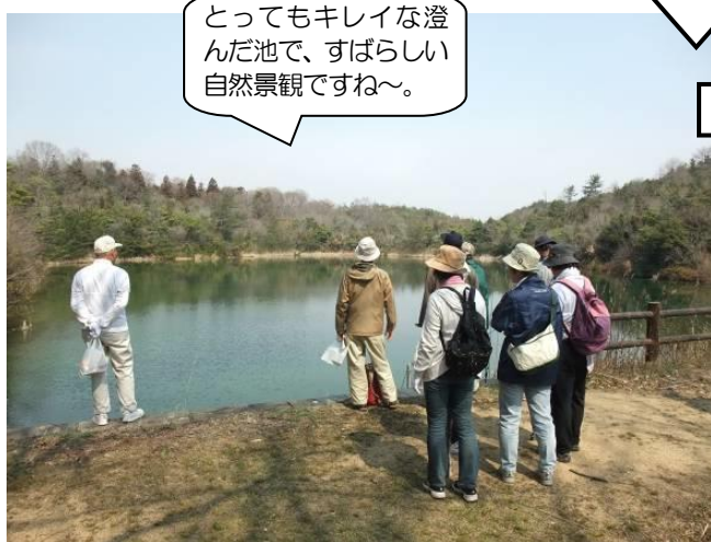
とってもキレイな澄んだ池で、すばらしい自然景観ですね～。