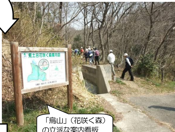
「烏山」(花咲く森)の立派な案内看板