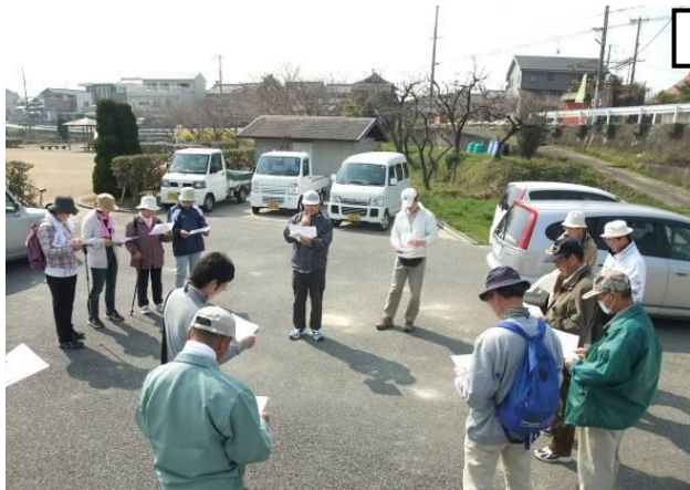
• 農村公園で全体説明