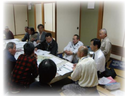
第5回まちづくり協議会