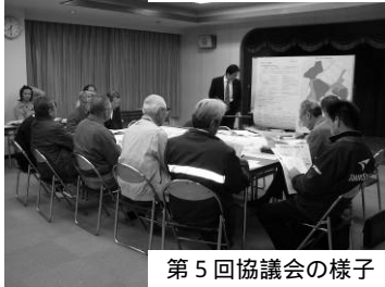
第 5 回協議会の様子

2月27日(水)神木公民館において、「第4回まちづくり協議会」を開催しました。 町内住民の皆さん11名、市開発審査課職員3名、まちづくりアドバイザー2名が参加し、前回の意見を基に作成したまちづくり構想図、区分図について説明を行い、まちづくりに関する方針について意見交換を行いました。 また、3月27日(木)神木公民館にて、「第5回まちづくり協議会」を開催しました。 町内住民の皆さん11名、市開発審査課職員3名、まちづくりアドバイザー2名が参加し、まちづくりに関する方針、まちづくり構想図、区分図について最終的な意見交換を行った後、来年度の活動について話し合いました。