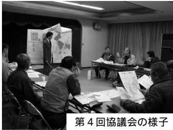
第 4 回協議会の様子