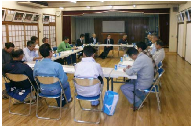
■第1回まちづくり協議会役員会の様子

当日は、コンサルタントによる「田園まちづくり制度の概要」や「田園まちづくり計画策定の全体及び今年度の活動スケジュール（予定）」についての説明の他、第1回アンケート調査の内容についても協議しました。