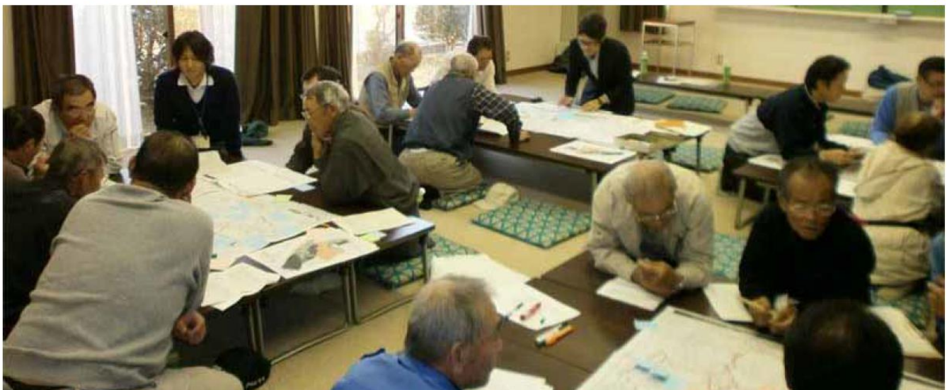
・第2回まちづくり協議会ワークショップの様子