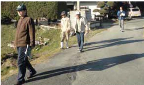
・まち歩きの様子