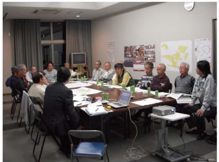
▲ 和やかな雰囲気の中で活発な意見交換

アドバイザーから「田園まちづくり制度の概要や今年度の活動の進め方」の説明の後、「第1回アンケート調査」の内容や「まち歩きワークショップ」について協議しました。今年度の活動の目標としては、地区の資源や課題を整理し、船町がめざすべき「 地区の将来像 」の検討に結びつけていくこととしています。