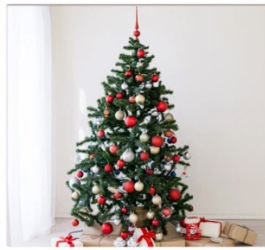
クリスマスツリー 展示・飾り付け