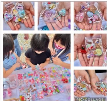
ワークショップ ハンドメイド雑貨