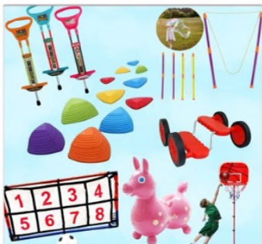
わんぱくコーナー