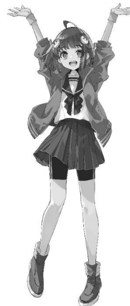
加古川市まちの魅力発信キャラクター 「かこのちゃん」

記入漏れがないかご確認のうえ、 返信用の封筒に入れて、切手を貼らずに 令和8年1月6日(火) までにポストへ入れてください。