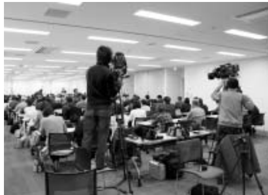
昨年のかこがわ学講座のようす。講座はBAN-BANテレビで放映されるそうです。

調査後、友人たちを「いつしよにかこがわ人になろう」と誘いまくった結果、買い物先で出会った友人から「やあ、かこがわ人！」と呼ばれる始末。検定を受けずして立派な加古川人になってしまったのでした。