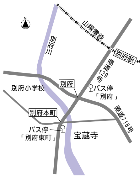
JR加古川駅からかこバス別府行で約25分「別府」下車徒歩約5分、または海洋文化センター行で約27分「別府東町」下車徒歩約2分