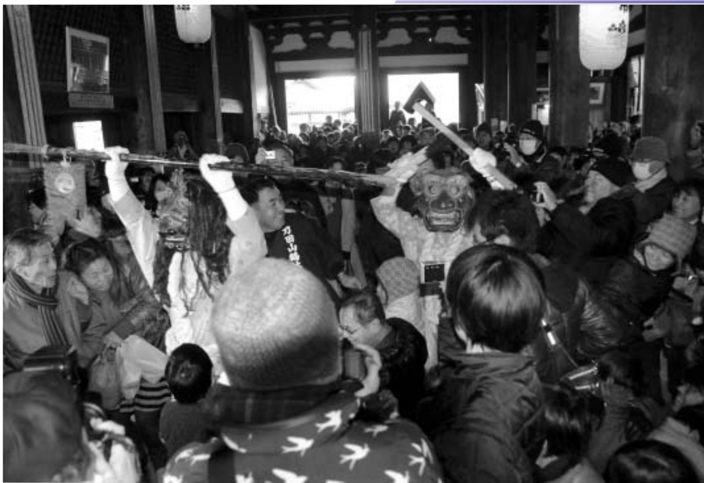
鶴林寺で開催された「修正会(鬼追い)」 のようす(1月8日)。