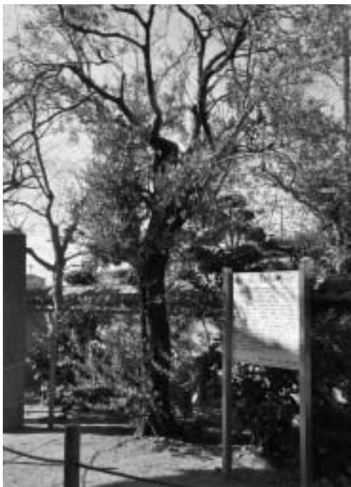
日本最古のオリブの木