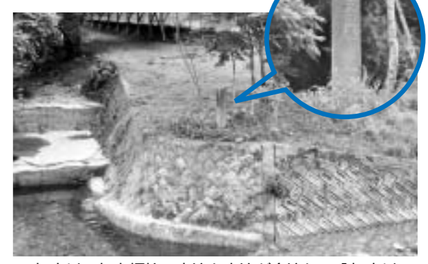
加古川の起点標柱。本流と支流が合流して「加古川」誕生！

さて今回の調査場所は、市内から北へ車で走ること約二時間、加古川の始まりがあると聞いた「源流の里」（丹波市青垣町大名草地区）。川幅は狭く、水面からはゴツゴツとした大きな石が姿を現して、歩いて渡れそうなどころもありません。水が澄んでいて、深みになっていくところは、まるでレンズのように川底まできれいに映し出しています。加古川の起点には標柱があるとのこと、実地調査開始。川沿いを歩き回り、本流と支流の合流地点に、ひっそりと立つ起点標柱をようやく発見！くわしく見るために、河原に下りて川を渡ることに。水の冷たさに驚きながら何と標柱前に到着