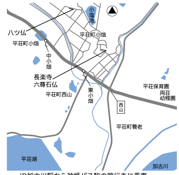
JR加古川駅から神姫バス駒の蹄行きに乗車「ハツ仏」は中小畑、「長楽寺」は東小畑で下車

石の文化圏とも呼ばれている加古川市には石造文化財が豊富に残っています。なかでも石棺石仏は、現在までに国内で確認されている八割以上が加古川・加西両市に分布しています。その理由については未解明な部分が多いのが現状です。石棺石仏とは、古墳の中に安置されていた石製の棺が何らかの理由で地表に露出し、後世にその一部分のふた石や底石に仏像が彫られたものです。十四世紀半ばの南北朝時代から室町時代にかけての作品が多く、仏像に阿彌陀像が多いことから浄土信仰の広まりと関連があると指摘されています。