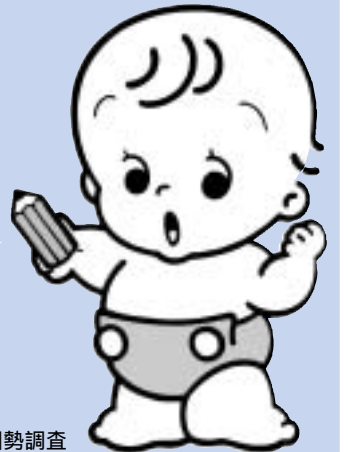
国勢調査 イメージ キャラクター セバスク

いよいよ10月1日、全国一斉に国勢調査が行われます。5年に1度行われる国勢調査は、日本に住んでいるすべての人が対象なんだよ。調査内容は、就業状態や、通勤・通学地、住宅の床面積などの20項目なんだ。みんな協力してね。