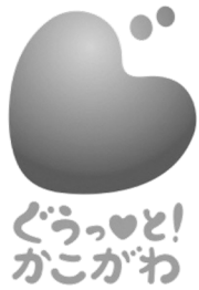
加古川市 ブランドメッセージ・ロゴ

記入漏れがないかご確認のうえ、 返送用の封筒に入れて、封をとじ、切手を貼らずに 11月30日(木)までにポストへ投函してください。