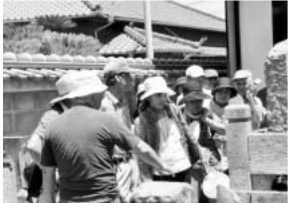
現地を見て歩きながらの講師の話にみなさん興味津々。

ている講座に参加することにしました。ここでは、町内会や高齢者大学、郷土史家などが委員会をつくって座学や現地見学など全10回の講座を企画しています。この日は木造の家屋が残り昭和初期の雰囲気が漂う二ツヶ社宅や、その昔加古川城があったといわれる称名寺周辺を現地見学。前回座学で学んだことを実際に現地に行き確認していきます。みなさんに受講理由を聞くと、退職を機に地元のことをもっと知りたくなった、称名寺の近所に引っ越したことがきっかけとなったなどさまざま。説明を聞きながら歩いてみると、質問も出てきて話がどんどん膨らんでいきます。現在白い壁の二ツヶ社宅倶楽部という洋館は、約100年前に建築された当初はピンク色の壁だったことや、約90年前の加古川河川改修には、東京スカイツリー建設よりも多くの費用がかかったことなど、本には載っていないようなことを知ることができて大興奮。見学が終わる頃には学んだことを早く周りの人に伝えたい！という気持ちで湧いてきて自分でも驚きました。