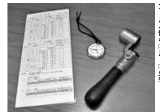
運転する時の必需品。ブレーキハンドルと懐中時計、時刻表。