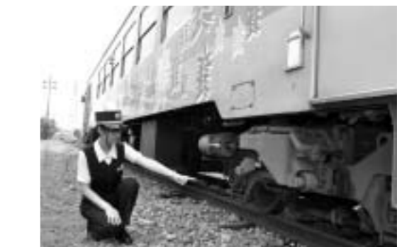
運行前に行う出庫点検。ブレーキやエンジンを指差し確認して安全をチェックします。

書いてある列車や踏切の部品名がわからず事務作業も大変でした」と振り返る。当初から、運転士にとの誘いもあったが、人を乗せて列車を運転するのは怖いと乗り気ではなかった。しかし、二年目を迎える経理の仕事にも慣れてきた頃、もっと鉄道に関する専門的な知識を得たいとの思いが出てきて運転士を目指すことに。同期入社した女性が先に運転士の免許を取ったことも決断を後押ししたそう。