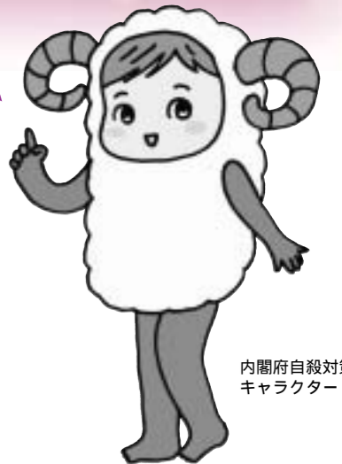
内閣府自殺対策キャラクター

疲労の回復に必要な睡眠をとることができないと、昼間に眠気に襲われる、体がだるい、頭痛がするなどの身体的な症状や、ちよつとしたことでイライラする、仕事に集中できないなどの精神的な症状が現れることがあります。さらに、高血圧や糖尿病などの生活習慣病のリスクを高めたり、体の免疫力が低下して風邪などの感染症にかかりやすくなったりします。心と体の健康を守るために、よい睡眠のポイントを確認しましょう。