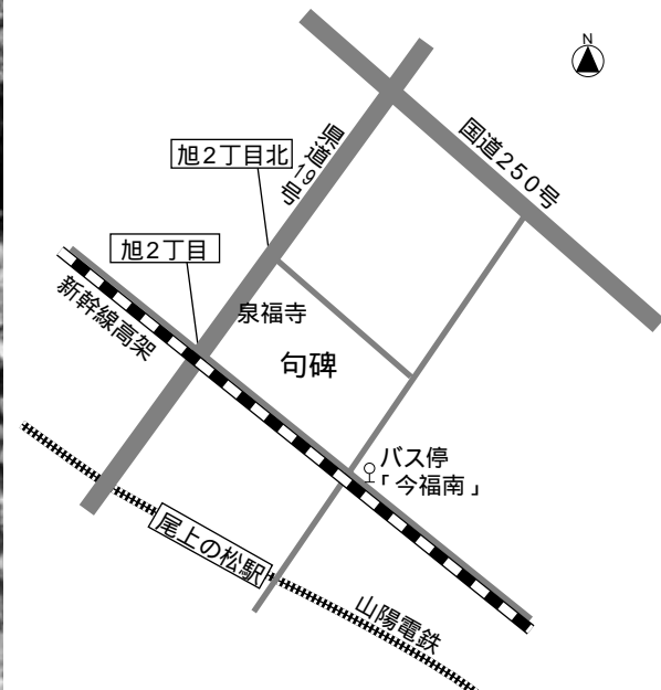
JR加古川駅からかこバス尾上公民館前行で約20分「今福南」下車徒歩約5分