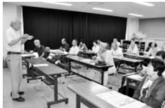
野口公民館の講座。郷土に詳しい人たちを講師に招き、いろんな角度から地域のことを学びます。

加古川 公民館では受講生OBが「案内人の会」を立ち上げ、学んだことを周りの人に伝えていく取り組みを始めています。昨年は加古川小学校4年生の「ま