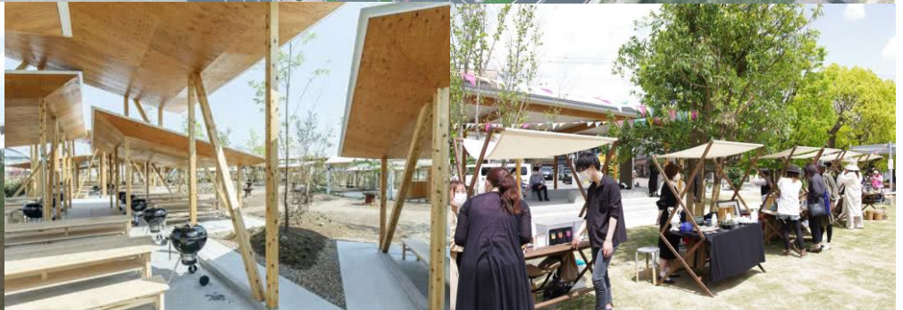
導入イメージ (バーベキューエリア)