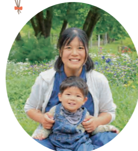
今月のファミリー

水に入ったり水遊びはできるのですが、水に飛び込むことを怖がっていたんです。でも、コーチや他のプール利用