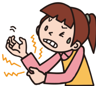
しびれる I feel numb. 麻了