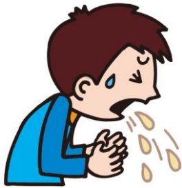
はいた I vomited. 我呕吐了