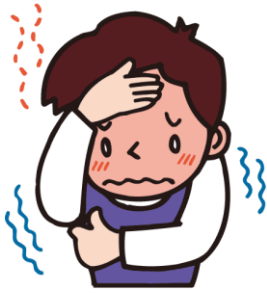
ねつ 熱がある I have a fever. 我发烧了