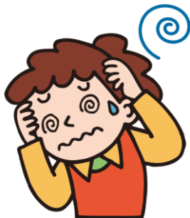
めまいがする I feel dizzy. 我头晕