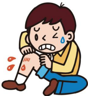
けがをした I got injured. 受伤了