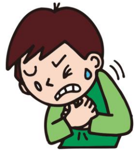
くるしい I'm in pain. 我很难受