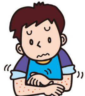
かゆい I feel itchy. 痒