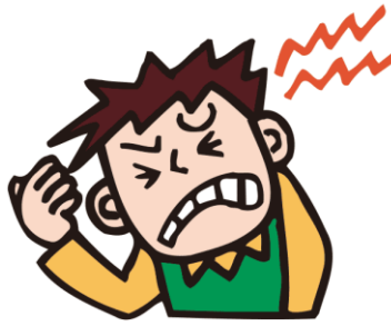
いたい I feel pain. 我很疼