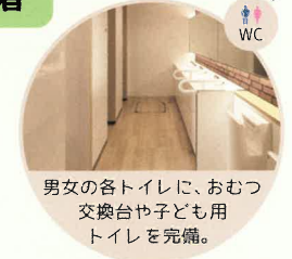
男女の各トイレに、おむつ交換台や子ども用トイレを完備。