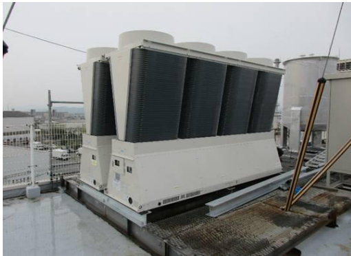
ア. 省エネタイプ 冷凍機に更新