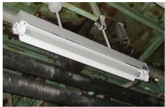
エ. 防爆型屋外灯のLED化