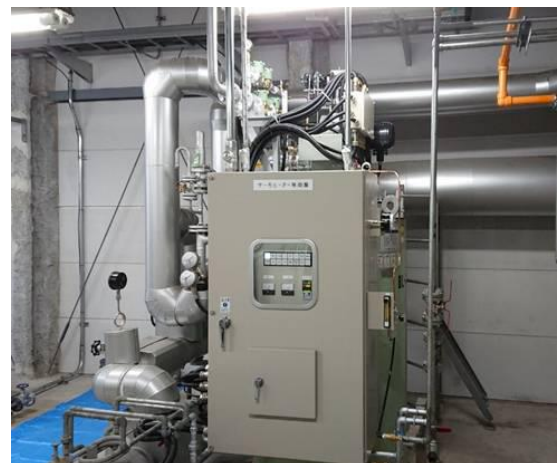
イ. FPC 熱媒ボイラー ガス化