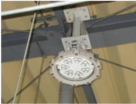
ウ. 屋内水銀灯のLED化