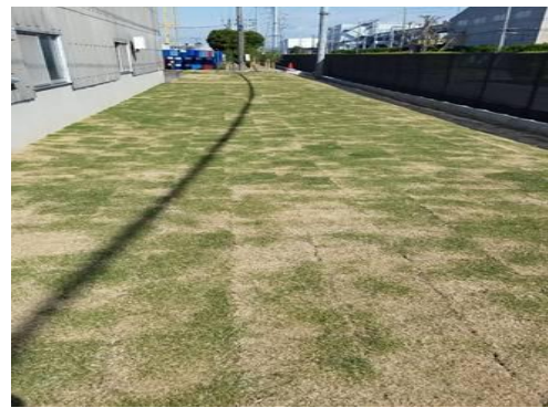
緑地整備 (芝生張替え)