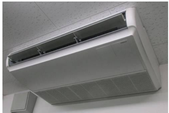
イ. 省電力エアコンに更新