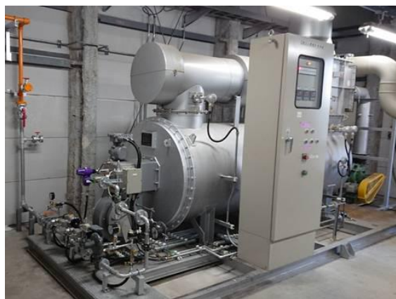
ウ.FPC 排ガス焼却炉 ガス化