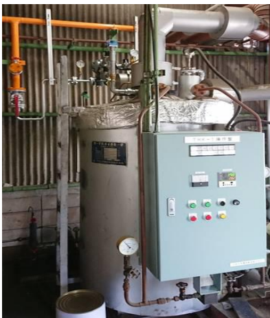
ア. 屋外P 熱媒ボイラー ガス化