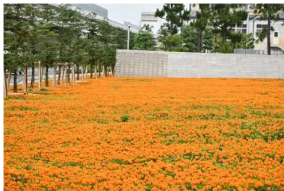
マリーゴールド植栽