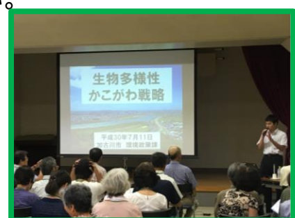
公民館での生物多様性講座