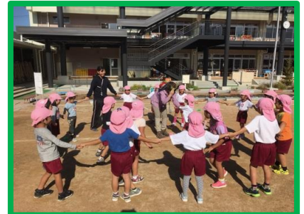
専門講師による「自然とあそび！ネイチャーゲーム」講座