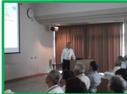
専門講師による地球温暖化対策講座

市内の学校園、町内会、市民団体等で、受講希望者が概ね10名以上であれば、どなたでも申込が可能です。