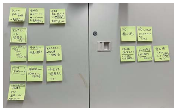
出された質問やご意見