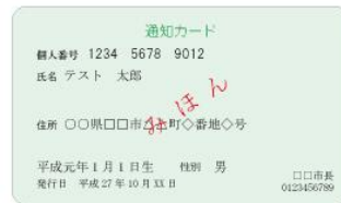
(表面) 通知カード (裏面)