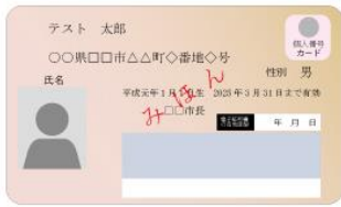
(表面) 個人番号カード (裏面)